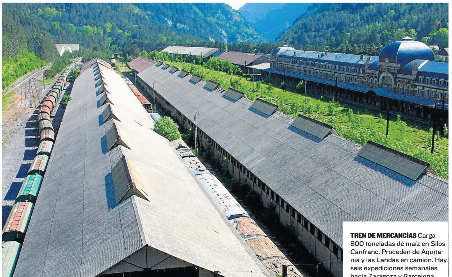
TREN DE MERCANCÍAS Carga 800 toneladas de maíz en Silos Canfranc. Proceden de Aquitania y las Landas en camión. Hay seis expediciones semanales hacia Zaragoza y Barcelona.

Es el último tren de mercancías que sale desde Canfranc, estación que contempló jornadas doradas del trasbordo en los años 1940-1944 durante la Segunda Guerra