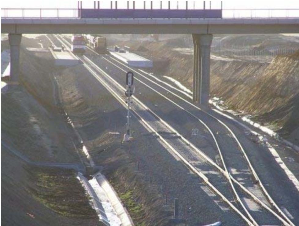
(foto 1) Vista del PAET, con el tren de trabajo en desviada y el “tamagochi” Canfranc-Zaragoza (anormalmente detenido) en vía directa.

Dado que entre las ahora colaterales estaciones de Tardienta y Ayerbe hay más de 54 km., puesto que Plasencia del Monte ha pasado a ser un mero apeadero, ha sido necesario crear un puesto de adelantamiento y estacionamiento de trenes (PAET) entre los PK 2,8 y 4,0. Se le ha denominado PAET “Hoya de Huesca” y desde él se pretende abrir un acceso ferroviario a la Plataforma Logística Huesca Sur, en construcción. Se han creado así dos cantones, uno de 19 km. y otro de 35 km., aproximadamente.