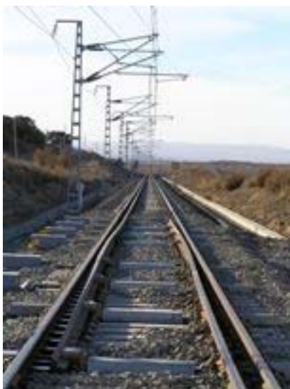
Foto 4 Primer cambiador de lado.

Como bien se aprecia en la foto 5, los cambiadores de lado de carril común disponen de ocho motores, cuatro por cada espadín, lo que permite al tren atravesarlos a una velocidad elevada (hasta 100 km/h).