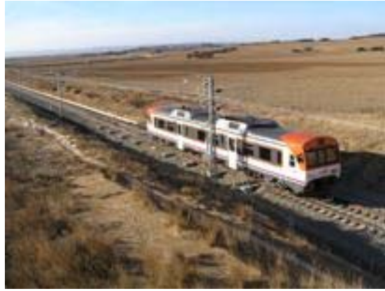
Foto 6. Un “tamagochi”, sobre el primer cambiador de carril común.

Inmediatamente después del primer cambiador nos encontramos con el primer desvío, que marca el inicio de la variante y al que se entra de punta (foto 7). Por él se desviarán los trenes directos Tardienta-Sabiñánigo-Jaca-Canfranc, mercantes en su práctica totalidad.