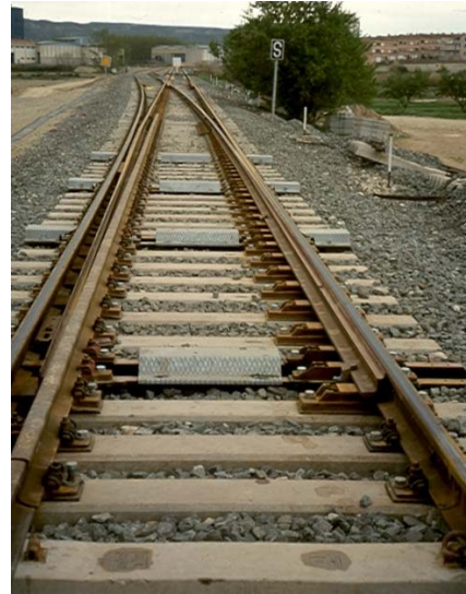
Foto 8. Desvío instalado en Tardienta.

Nada más salir de este primer desvío de la variante volvemos a encontrarnos con un sorprendente segundo cambiador de lado, que sitúa de nuevo el carril común a la izquierda, que es su posición normal en esta línea. Y decimos sorprendente porque solamente dos kilómetros más adelante, en la conexión del by-pass Huesca-Jaca, entramos en un tercer cambiador de lado, que podemos observar en la foto 5, justo antes del segundo desvío especial.